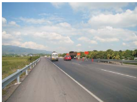
La construcción de estas obras generó unos 300 empleos en su etapa de mayor ejecución.