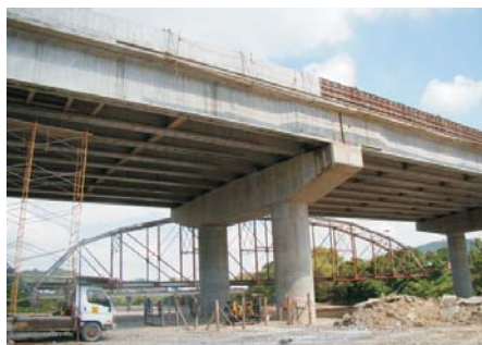
El puente nuevo sobre el Río Ulúa es el puente más largo de cuatro carriles continuos.