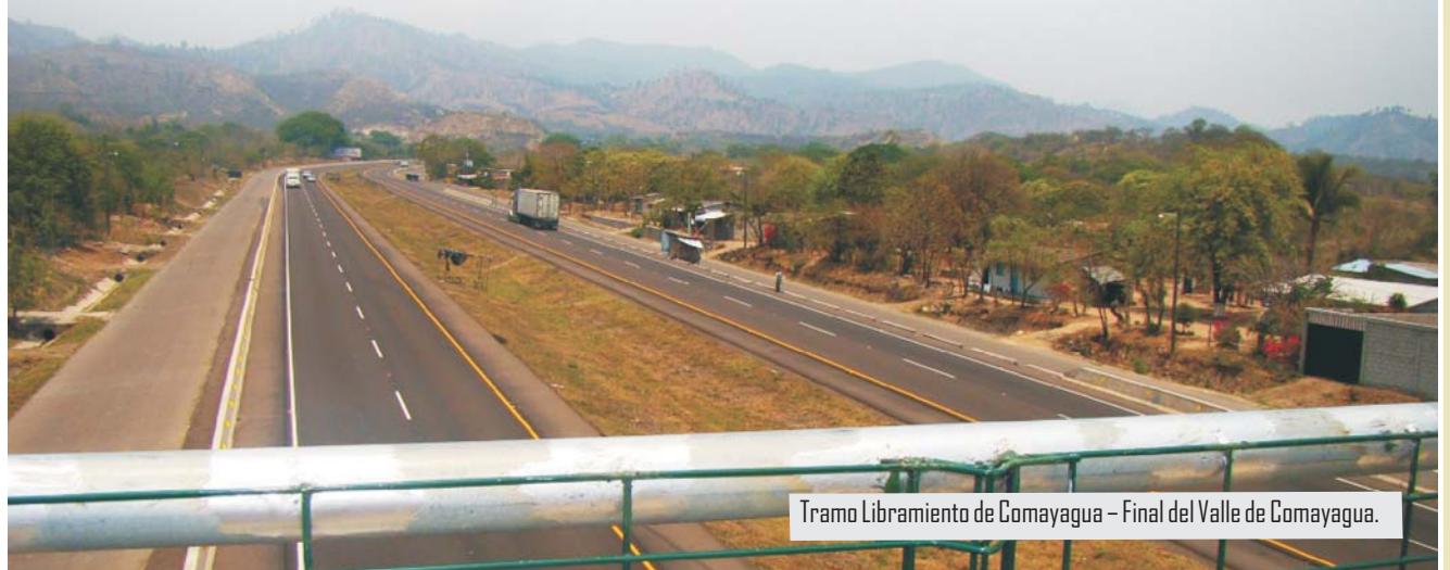
Tramo Libramiento de Comayagua – Final del Valle de Comayagua.

Funcionarios de esta Unidad, Soptravi y Fondo Vial realizaron recientemente la recepción de las obras de parte de las empresas contratista y supervisora.