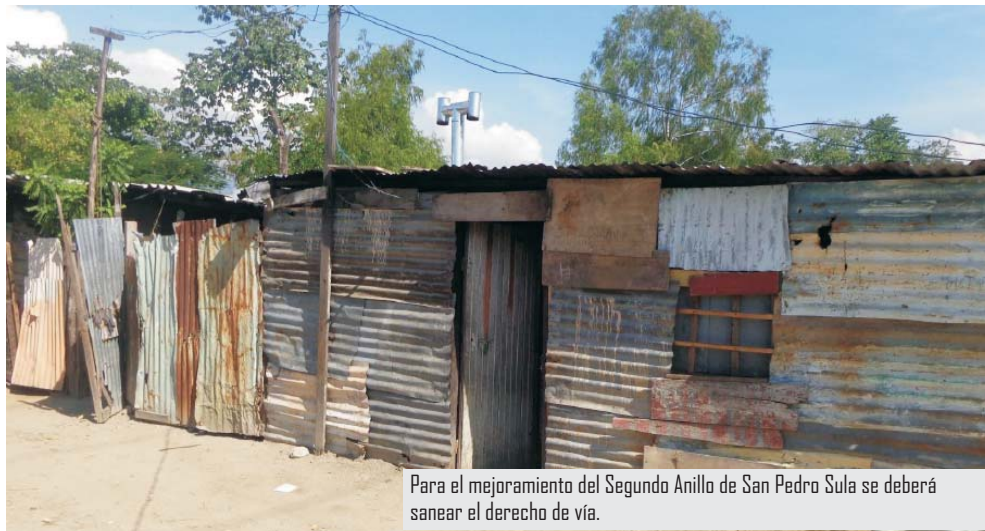
Para el mejoramiento del Segundo Anillo de San Pedro Sula se deberá sanear el derecho de vía.

La Unidad de Gestión de Proyectos InvEst - Honduras también Cuenta del Milenio - Honduras, tiene amplia experiencia en la aplicación de políticas de reasentamiento involuntario, al haber implementado con éxito la Política de Reasentamiento en cuatro secciones de la Carretera CA-5 Norte financiadas por la Corporación Desafía del Milenio, MCC y el Banco Centroamericano de Integración Económica, BCIE, así como en otras cuatro secciones que fueron también financiadas por el BID.