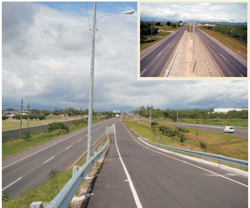
Tramo Villa de San Antonio - Libramiento de Comayagua, donde se construyó una nueva calzada que la convierte en una vía de cuatro carriles .

Las obras en este tramo de 24.46 Kilómetros que inician en el desvío a la Villa de San Antonio consisten en la construcción de una nueva calzada con dos carriles adicionales al lado derecho sentido sur - norte de la carretera actual y la rehabilitación de los dos carriles existentes en toda la longitud separados por una mediana.