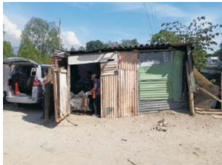
Las familias que viven en los bordos del Río Bermejo se encuentran en el derecho de vía del Corredor Logístico en condiciones de marginalidad y pobreza extrema.