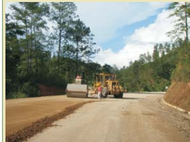
Tramo San Esteban- El Carbón del Corredor Agrícola.

La Cuenta del Milenio – Honduras también InvEst - Honduras, ha desarrollado en los últimos cinco años los más grandes e importantes proyectos carreteros del país, aplicando normas internacionales que permiten que cada uno de los procesos se realice de forma transparente y de manera eficaz y eficiente.