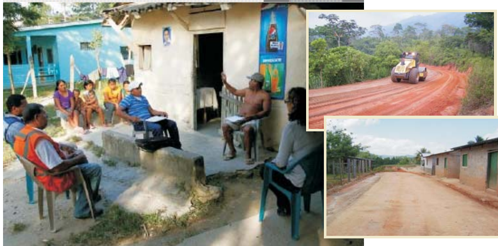
Líderes de la Comunidad Pech de Santa María de El Carbón conversan sobre el Convenio de Cooperación con esta Unidad.

El Carbón, Olancho.- En el marco de cumplimiento del Convenio de Cooperación firmado con miembros de la comunidad indígena Pech de Santa María de El Carbón, con el objetivo de continuar los trabajos de pavimentación en el tramo San Esteban - El Carbón del Corredor Agrícola, esta Unidad de Gestión de Proyectos ha ejecutado varias obras y mejoras en los servicios comunitarios que fueron priorizadas por la comunidad, el Consejo de Tribu y El Cacique.