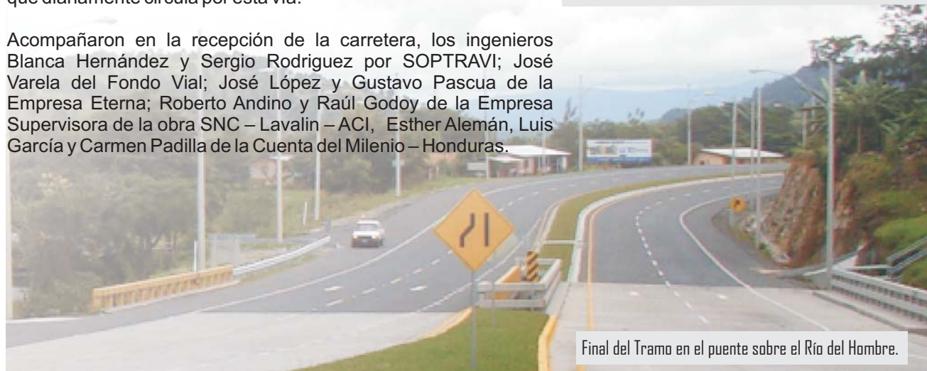
Final del Tramo en el puente sobre el Río del Hombre.