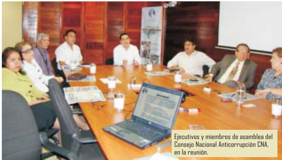
Ejecutivos y miembros de asamblea del Consejo Nacional Anticorrupción CNA, en la reunión.

Bográn aprovechó para agradecer el constante apoyo y reconocimiento de la sociedad civil, al tiempo que les motivó sobre la necesidad de seguir trabajando todos, cada quien según su función, por una Honduras más competitiva.