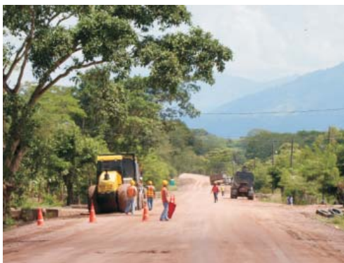
Con la firma del Convenio con la comunidad Pech se podrá continuar con los trabajos en el tramo San Esteban - El Carbón en el Corredor Agrícola.

Con la firma de este Convenio se logrará continuar exitosamente la pavimentación del tramo carretero, la comunidad de Santa María del Carbón será fortalecida en su infraestructura y se habrá cumplido el principio establecido por el Convenio 169 de la Organización Internacional del Trabajo (OIT) sobre la libre determinación de los pueblos indígenas.