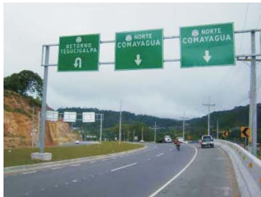
Parte del tramo Tegucigalpa-Río del Hombre.