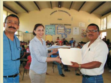
Para construcción del Corredor Agrícola Firma de Convenio de Cooperación Mutua con comunidad Pech