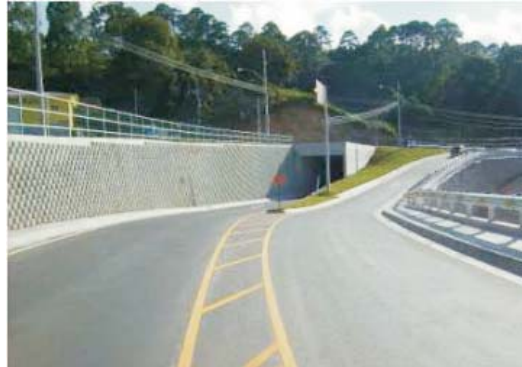
Intercambio El Durazno, Carretera CA-5 Norte.