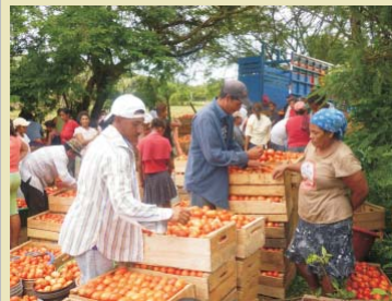
Se expande Fideicomiso de la Cuenta del Milenio - Honduras