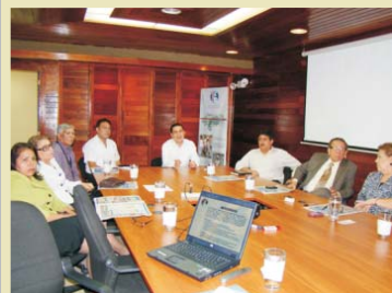
En diálogo con la Sociedad Civil