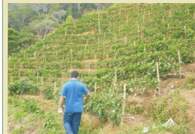
El Fideicomiso Agrícola ahora cubre otros rubros.

Tegucigalpa.- En Sesión del Comité Técnico de Gestión y Supervisión del Fideicomiso Agrícola realizado recientemente se aprobó la modificación a los lineamientos operativos del Fideicomiso con lo cual se incluyen todas las actividades agrícolas y agropecuarias como rubros elegibles para ser financiados con los fondos del Fideicomiso Agrícola heredado por la Cuenta del Milenio- Honduras a la Secretaría de Finanzas.