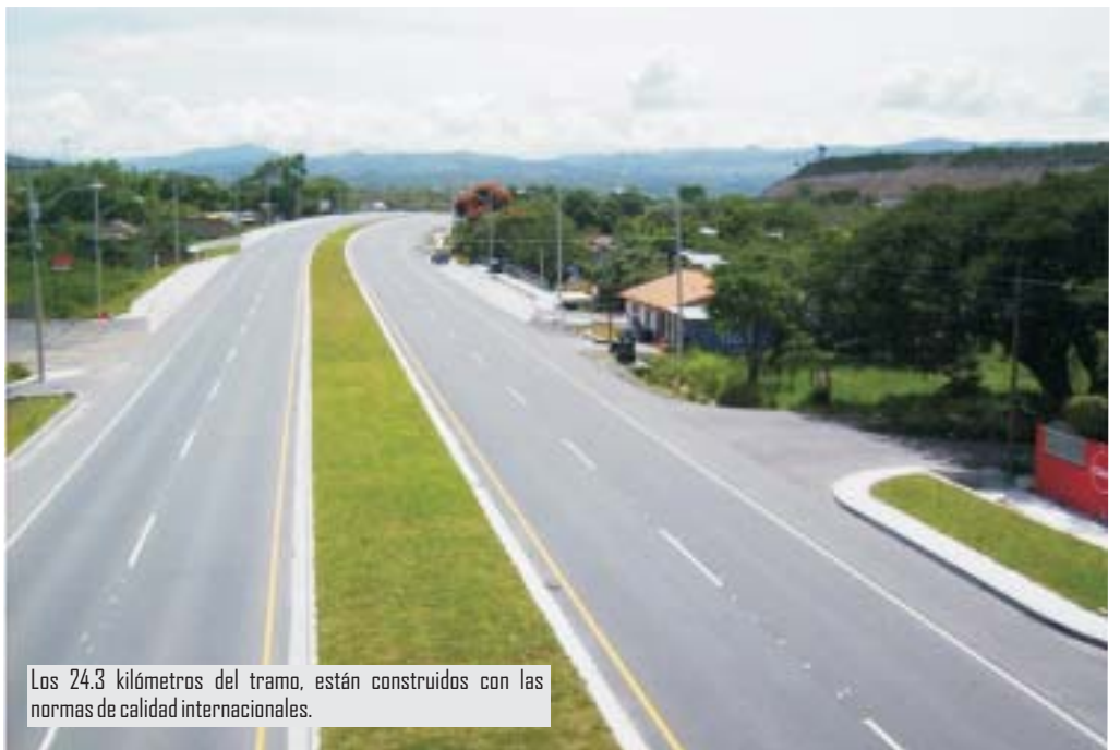
Los 24.3 kilómetros del tramo, están contruidos con las normas de calidad internacionales.