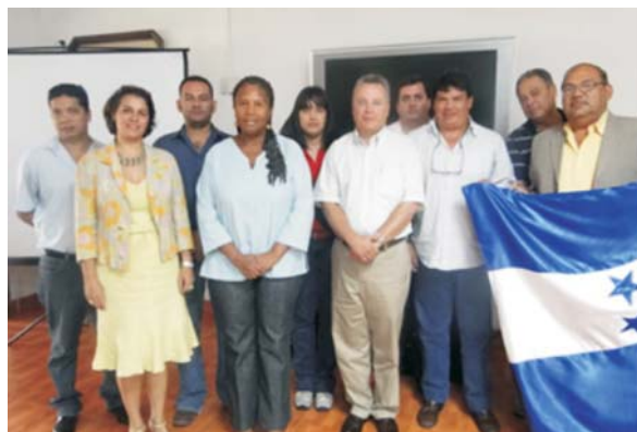
Dentro de la junta directiva de AGROEXH, cinco de los cargos son ocupados por productores que fueron beneficiados por el programa MCA-H/EDA.

Tegucigalpa.- Con las bases dejadas por el Programa Entrenamiento y Desarrollo de Agricultores (MCA-H/EDA) que financió la Cuenta del Milenio – Honduras en 16 de los 18 departamentos del país, se juramentó recientemente la primera Junta Directiva de la Asociación de Agroexportadores de Honduras (AGROEXH) que aglutina a productores que gracias a la asistencia técnica brindada por MCA-H/EDA, ahora exportan sus productos agrícolas a nivel regional e internacional.