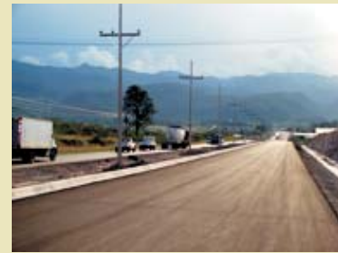
Los fondos adicionales comenzarán a ejecutarse una vez la notificación y acuerdos se hayan publicado en el Diario Oficial La Gaceta.

El pleno del Congreso de la República aprobó el préstamo por el orden de 28 millones de dólares que serán administrados por la Cuenta del Milenio - Honduras para complementar los trabajos de ampliación y mejoramiento de la Carretera CA-5 Norte y para la construcción del Interconector Milenio.