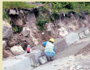
Revestimiento de cuneta con concreto en el Km. 54 de la sección Río del Hombre - Inicio del Valle de Comayagua.

Las Mercedes, La Villa de San Antonio.- Cunetas, bordillos y siembra de Vetiver son algunas de las medidas que se realizan en el tramo Río del Hombre - Inicio del Valle de Comayagua con la finalidad de prevenir la erosión del suelo.