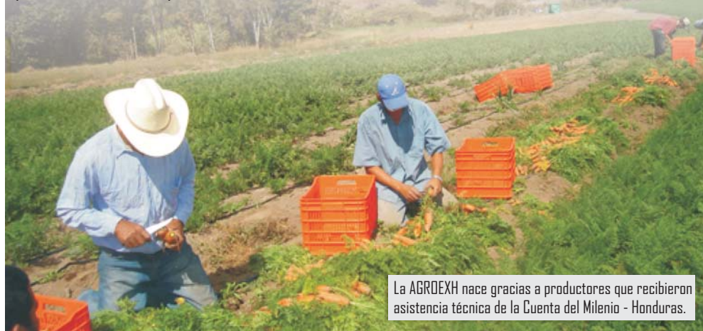
La AGROEXH nace gracias a productores que recibieron asistencia técnica de la Cuenta del Milenio - Honduras.

MCA-H/EDA benefició a más de 6 mil agricultores hondureños, quienes gracias a la asistencia técnica y acceso a financiamiento convirtieron su producción en rentable y sostenible, lo que resultó en un aumento en los ingresos rurales y en la generación de oportunidades de empleo.