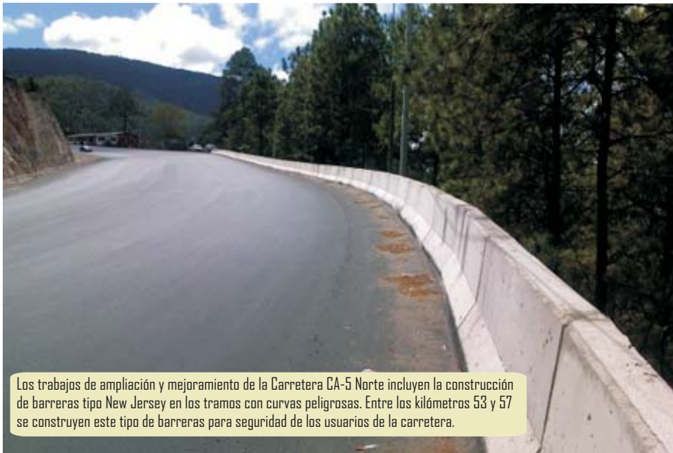
Los trabajos de ampliación y mejoramiento de la Carretera CA-5 Norte incluyen la construcción de barreras tipo New Jersey en los tramos con curvas peligrosas. Entre los kilómetros 53 y 57 se construyen este tipo de barreras para seguridad de los usuarios de la carretera.

Se prevé que las obras finalicen en diciembre de este año. Los trabajos iniciaron en 2009 con fondos de la Corporación del Desafío del Milenio y actualmente son co financiados por el Banco Centroamericano de Integración Económica (BCIE).