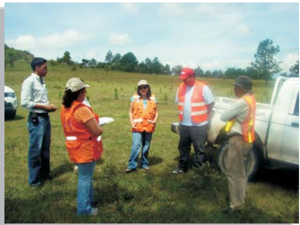
Equipo de la Cuenta del Milenio con los encargados de la empresa supervisora y contratista de la obra, en la sección Río del Hombre - Inicio del Valle de Comayagua.

El Jicarito, Comayagua.- Como parte de las medidas de compensación por las obras de construcción en la Carretera CA-5 Norte, 16 mil 100 plántulas de pino están reforestando 16 hectáreas de bosque en la comunidad de El Jicarito en el municipio de La Villa de San Antonio, Comayagua. Esta área forma parte de la reserva forestal de la represa El Coyolar y del espejo de agua de la quebrada “India Vieja” que abastece del vital líquido a las aldeas de Santa Ana y San José en ese municipio.