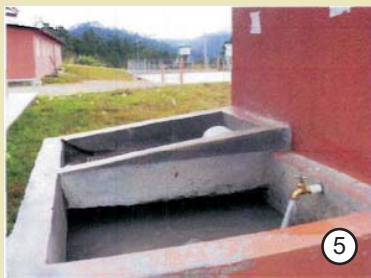
Instalan sistema de agua potable en la colonia Milenio "Pumas".