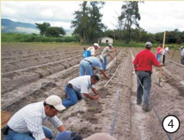
Programa MCA-H/EDA logra sus metas.