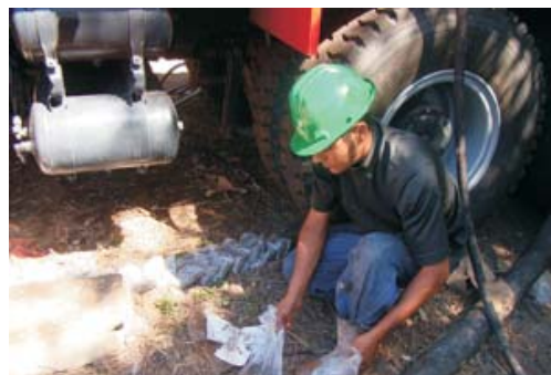
Trabajadores de la perforación seleccionan las muestras los tipos de suelo encontrados en la finca de se realiza el pozo.

La maquina donada por la Cuenta del Milenio tiene una capacidad de profundidad de perforación de 100 metros y puede perforar hasta dos pozos por día.