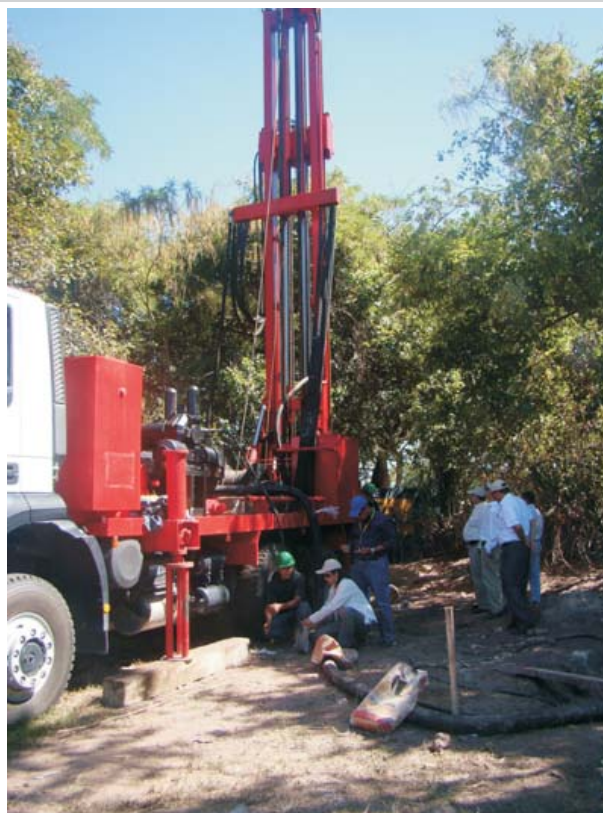
Camión donado por la Cuenta del Milenio - Honduras.

La Cuenta del Milenio trabajando eficazmente para la generación de crecimiento económico en Honduras.