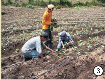
Fideicomiso de la Cuenta del Milenio, continua apoyando a los agricultores del país.