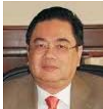
William Chong Wong Secretario de Estado en el Despacho de Finanzas

"La Cuenta del Milenio para mí es el mejor ejemplo de ejecución, a nivel mundial es un ejemplo. El caso de Honduras ha sido premiado a nivel mundial, primero porque es multisectorial abarcando una serie de situaciones. Con la Cuenta del Milenio se favoreció a más de 6,500 familias del área rural que las sacó de la pobreza, porque una persona que ganaba familiarmente menos de un dólar, ahora anda en un promedio de cuatro o cinco dólares diarios y mucho más de ingresos, creando una cadena de producción y de exportación".