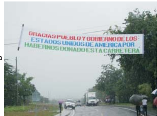
La pavimentación de la carretera Choluteca - Orocuina, beneficia a miles de familias del departamento de Choluteca.

La Cuenta del Milenio – Honduras, cuyo objetivo es apoyar la reducción de la pobreza vía crecimiento económico en el país, es el primer convenio de la Corporación Desafío del Milenio de los Estados Unidos de América, alrededor del mundo, en finalizar su implementación en el tiempo estipulado y alcanzando las metas establecidas, fortaleciendo los sectores de agricultura y transporte del país.