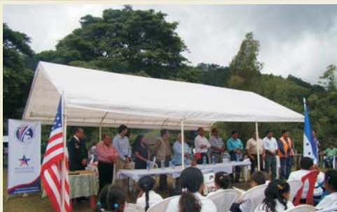
Autoridades de la Corporación del Desafío del Milenio y de la Cuenta del Milenio, presidieron los actos junto a autoridades locales y diputados del Congreso Nacional.