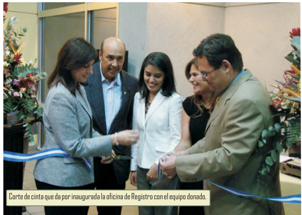
Corte de cinta que da por inaugurada la oficina de Registro con el equipo donado.

Ley de Garantías Mobiliarias Cuenta del Milenio - Honduras y Cámara de Comercio e Industria de Tegucigalpa firman acuerdo de Donación