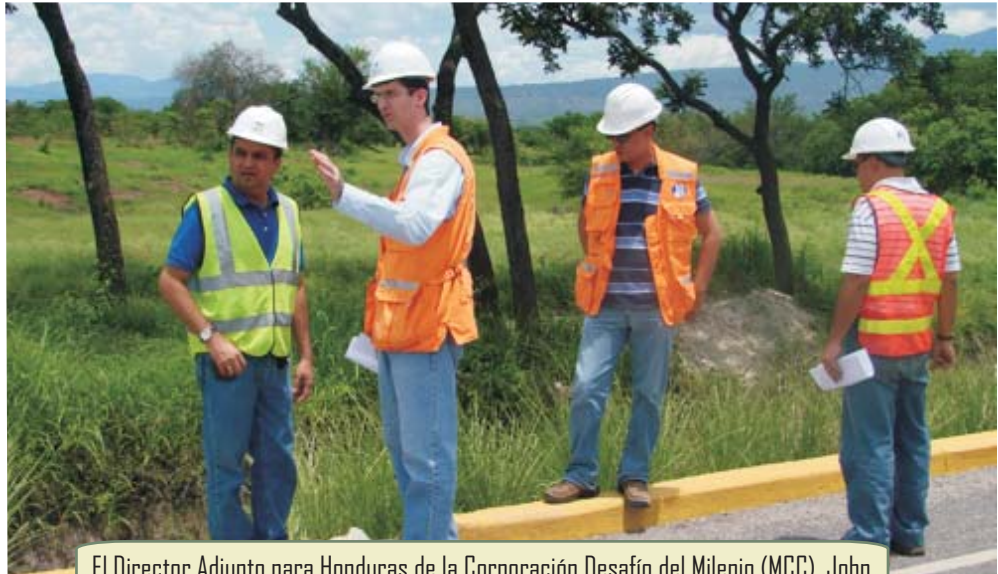
El Director Adjunto para Honduras de la Corporación Desafío del Milenio (MCC), John Polk, durante su recorrido por los trabajos de pavimentación de la carretera Comayagua-Ajuterique-Lejamani-La Paz.

Por este tramo circula un promedio de 750 vehículos diarios lo que representa unos 275 mil al año, la Cuenta del Milenio - Honduras al pavimentar esta vía propicia la reducción de los costos de viaje y conecta mercados, impulsando al crecimiento económico del Valle de Comayagua.