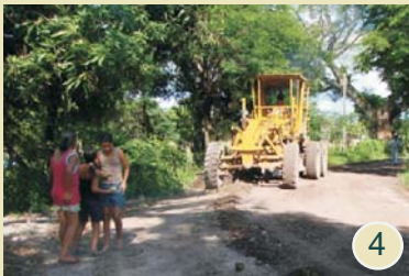
4 .Cuenta del Milenio - Honduras Generando desarrollo en las comunidades de Comayagua.