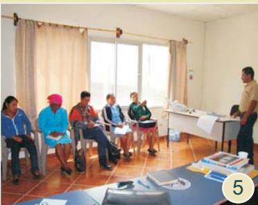
5 .Productores/as de Intibucá capacitados en actividades productivas.