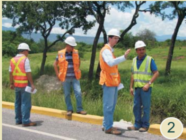
2 .Proyecto de Transporte Supervisan trabajos finales en la carretera Comayagua-Ajuterique- La Paz.