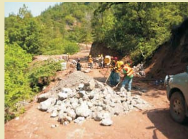
Este proyecto genera empleo directo al contratar mano de obra local.

Siete Kilómetros de carretera se han mejorado en el tramo que comunica el municipio de Ojos de Agua con Plan del Cerro, en Comayagua, comunidad donde se implementa el Proyecto Sistema Integrado de Producción (SIP), financiado por la Cuenta del Milenio - Honduras e implementado por el Proyecto Aldea Global.