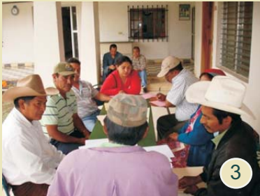
3 .Proyecto PROLENCA intercambia experiencias de éxito.