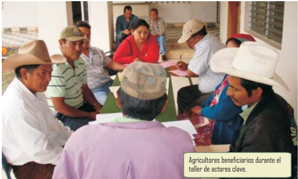
Agricultores beneficiarios durante el taller de actores clave.

A través de MCA-H/ACA más de 4,900 productores de 14 de los 18 departamentos del país cuentan con accesos a crédito formal.