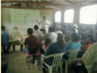
Socios de FUNDER en el departamento de El Paraíso, al momento de recibir la capacitación.

El Proyecto Acceso a Crédito para Agricultores (MCA-H/ACA), con el propósito de continuar capacitando a los socios de FUNDER, desarrolló un taller del Programa de Educación Financiera para Productores, impartido a un grupo de 21 productores/as del departamento de El Paraíso.