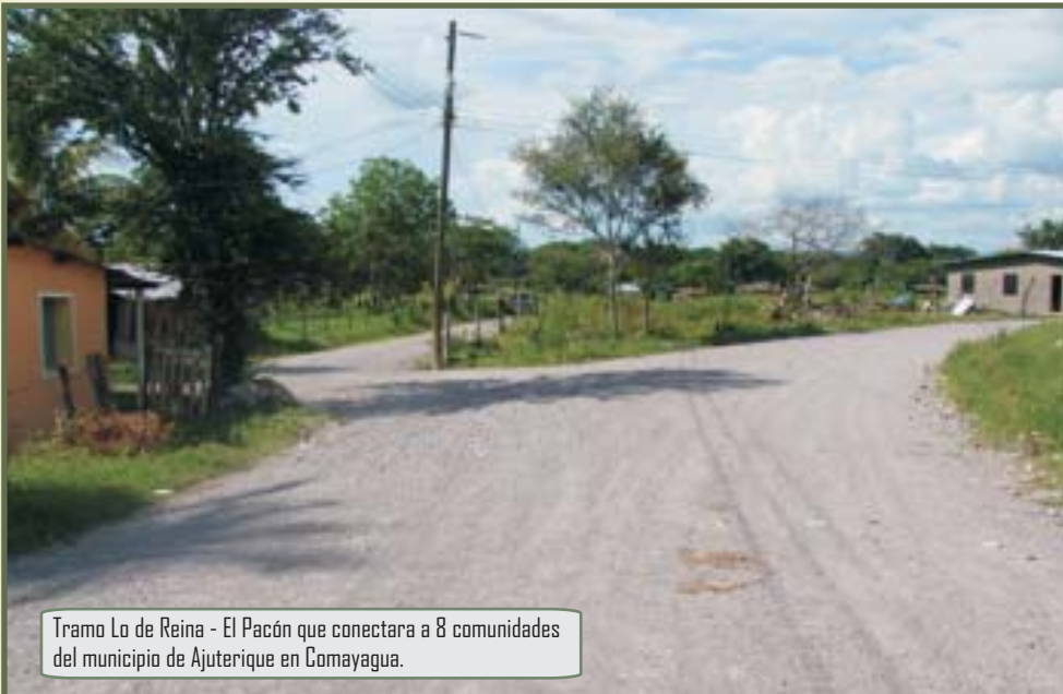
Tramo Lo de Reina - El Pacón que conectara a 8 comunidades del municipio de Ajuterique en Comayagua.

Lo de Reina, Ajuterique, Comayagua, junio de 2010. La Cuenta del Milenio-Honduras con el objetivo de generar crecimiento económico en el país, mejoró 22.79 Km de caminos rurales en el departamento de Comayagua beneficiando a más de 7 mil habitantes de las comunidades de Los Pozos, Lo de Reina, Playita, Terreros, Crucillal, Macuelizo, El Sifón y El Pacón.