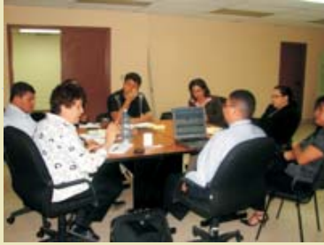
Miembros del Comité de Crédito de MCA-H/ACA.