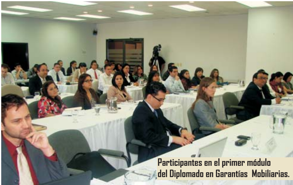
Participantes en el primer módulo del Diplomado en Garantías Mobiliarias.

Tegucigalpa, febrero 2010.- Con el propósito de capacitar a los operadores de la ley (sector financiero) en el uso, aprovechamiento y gestión de las garantías mobiliarias la Cuenta del Milenio-Honduras a diseñado, con la Asociación Hondureña de Instituciones Bancarias (AHIBA) y el National Law Center for Inter-American Free Trade, un diplomado en "Garantías Mobiliarias".