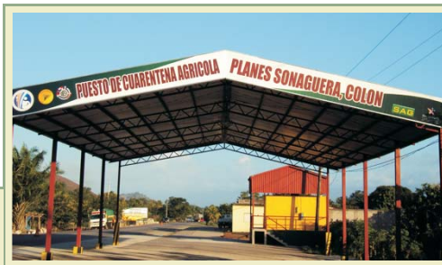
Los puestos de Cuarentena Agrícola han sido construidos para controlar el ingreso de productos/frutas hospederas de la Mosca del Mediterráneo.