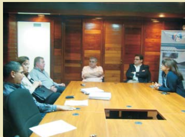
Representantes de la Constructora Diek y funcionarios de la Cuenta del Milenio- Honduras.

Dichos trabajos deberán iniciar a mas tardar a finales del mes de febrero de 2010. La Política de Reasentamiento promovida por la Corporación del Milenio busca reubicar a las familias que viven en el derecho de vía de los trabajos de mejoramiento y ampliación de la carretera CA-5 Norte.