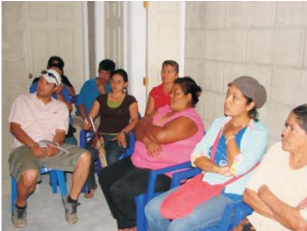
Representantes de las familias beneficiadas con la casa y local comercial en la Colonia Milenio Zambrano.

Una nueva Colonia Milenio, “La Zambrano”, beneficia a nueve familias que ya han recibido las llaves de sus casas y locales comerciales como parte de la Política de Reasentamiento implementada por la Cuenta del Milenio-Honduras. Los lugares de reubicación tienen mejores condiciones de infraestructura, equipamiento comunitario, salubridad e higiene que donde viven actualmente sumado a esto tendrán la oportunidad de fortalecer sus capacidades organizativas.