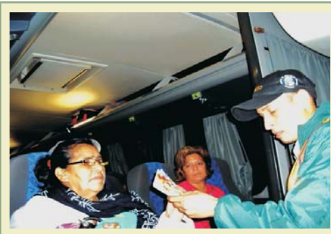
Momentos en que los inspectores de cuarentena explican a los pasajeras la importancia de la labor que desarrolla el programa MOSCAMED en esa zona.

El Programa MOSCAMED tiene el objetivo de lograr el reconocimiento como área libre de Mosca del Mediterráneo por parte de USDA/APHIS, organismo del departamento de Agricultura de los Estados Unidos de América encargado de asegurar la salud de animales y plantas y darle mantenimiento a este reconocimiento para lograr que los productos agrícolas producidos en la zona del Valle del Aguán en la región norte de Honduras, sean aptos para la exportación y que cumplan con los requisitos fitosanitarios exigidos por los mercados internacionales.