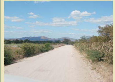
4.5 KM del Tramo Santa Ana de Yusguare-El Zapotillo en el municipio de Santa Ana en el departamento de Choluteca construidos con el financiamiento de la Cuenta del Milenio.

La Cuenta del Milenio- Honduras concluyó los trabajos de construcción de cuatro tramos de caminos rurales en los departamentos de El Paraíso y Choluteca que totalizan 41.5 Km de caminos construidos con el apoyo de las municipalidades de Soledad, Apacilagua y Marcovia.