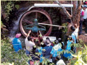
Los agricultores son capacitados para el manejo adecuado de los sistemas de riego.

Las capacitaciones están orientadas al uso y manejo de los sistemas de captación y conducción del agua para riego.