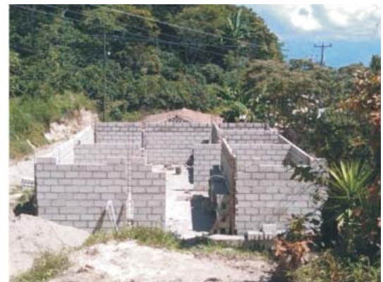
Centro Local de Almacenamiento que se construye en la comunidad de San Juan en el municipio de La Labor, Ocotepeque.