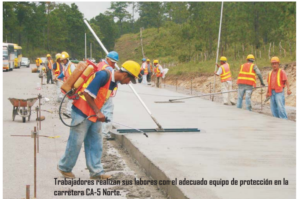
Trabajadores realizan sus labores con el adecuado equipo de protección en la carretera CA-5 Norte.

Unos 1,500 empleados en las diferentes secciones de los trabajos de mejoramiento de la principal vía de comunicación del país, la carretera CA-5 Norte, son protegidos con las medidas de seguridad laboral requeridas para este tipo de obras.