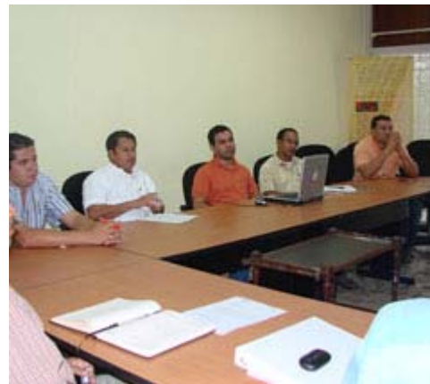
Parte de los asistentes a la reunión de coordinación.

Para lograr una coordinación eficiente y no utilizar la zona en la que se llevará a cabo la ampliación y rehabilitación de la carretera