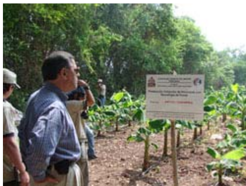
El embajador Vásquez durante su visita a una de las fincas.

Comayagua.- El embajador Gaddi Vásquez, representante de los Estados Unidos ante las agencias de Agricultura y Alimentación de las Naciones Unidas en Roma, Italia, visitó Honduras recientemente, con el objetivo de conocer los diferentes programas financiados por su país.