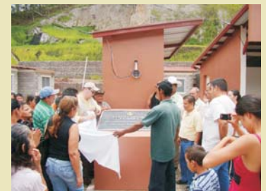
Momentos de la develación de la placa de la Colonia Milenio La Misión.

La Cuenta del Milenio – Honduras a través de su Proyecto de Transporte conecta mercados para la generación de crecimiento económico con responsabilidad social y tiene el apoyo solidario de las autoridades locales de este municipio de Taulabé.