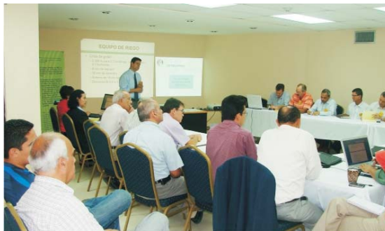
El evento contó con la participación de representantes de empresa, organismos como IICA, FAO, FUNDER, UNA y SAG y, técnicos especialistas de la Cuenta del Milenio y MCA-H/EDA.

Unas 10 empresas proveedoras de insumos asistieron a la jornada junto a representantes de organismos internacionales cooperantes en el fomento de la agricultura nacional, todos interesados al igual que la Cuenta del Milenio-Honduras, en mejorar la productividad de las fincas y en el fortalecimiento del mercado nacional a través de la modernización tecnológica y en la creación de mayores oportunidades para la agricultura nacional.