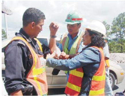
La atención médica es para todas las persona que transitan por los tramos en construcción.

Hasta la fecha se han atendido más de 10 accidentes viales gracias a la oportuna asistencia médica gratuita recibida de este grupo de hombres que engrandecen su profesión y a sus contratistas, en este caso, la firma M&S/Santa Fe y la Cuenta del Milenio-Honduras.