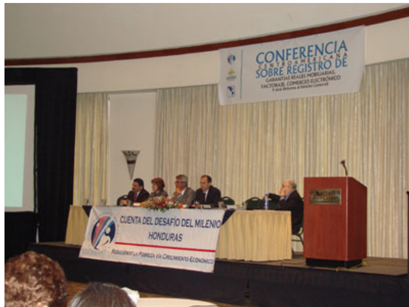
Parte de la mesa principal que presidió los actos.

Tegucigalpa.- La Cuenta del Desafío del Milenio – Honduras, el Centro Jurídico Nacional para el Libre Comercio Interamericano y la Asociación Hondureña de Instituciones Bancarias (AHIBA) realizaron el pasado 28 y 29 de febrero, el Congreso Centroamericano sobre Garantías Mobiliarias y otras reformas al Derecho Comercial, para dar a conocer, discutir y fomentar la aprobación de instrumentos legales que generarán apertura y