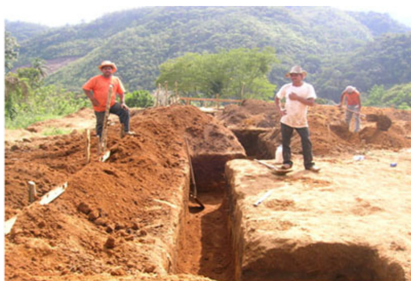
Santa Bárbara.- El pasado 13 de Febrero de 2008 el Instituto Hondureño del Café

La Cuenta del Milenio – Honduras recibió siete ofertas -de nueve pre calificadas- para los servicios de supervisión de la pavimentación de la Carretera Comayagua – Ajuterique – Lejamaní – La Paz. El Acto de recepción de propuestas técnicas y económicas se desarrolló en presencia de los representantes de las empresas participantes. Este tramo carretero conectará a los pobladores de Comayagua, Ajuterique, Lejamaní y La Paz, con la principal vía de comunicación del país.