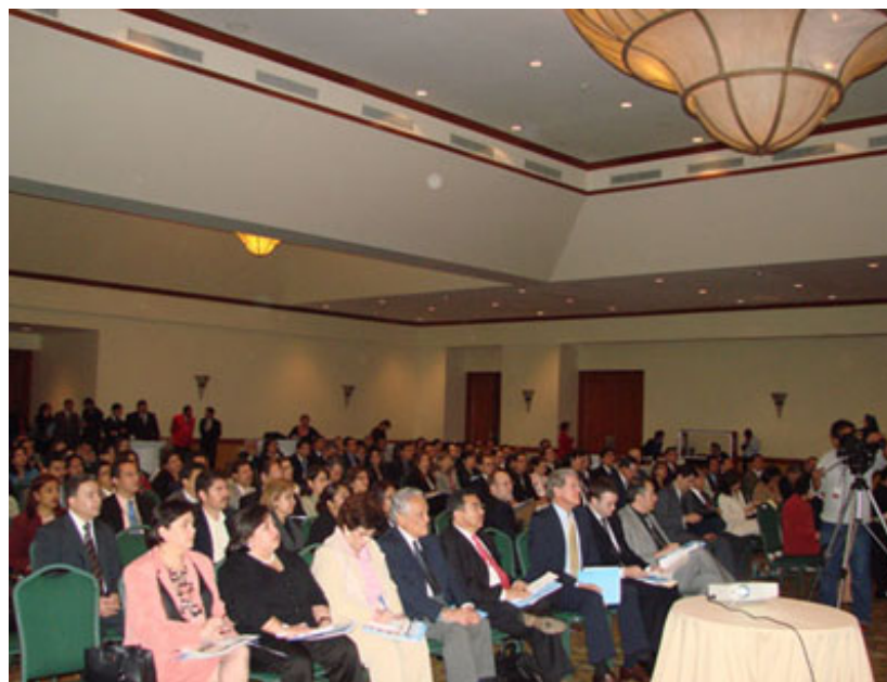
Parte de los asistentes a la Conferencia centroamericana.

La Cuenta del Milenio – Honduras además de impulsar la aprobación de la Ley de Garantías Mobiliarias actualmente en el Congreso Nacional de la República, financiará la creación y operación inicial del registro electrónico de garantías mobiliarias que se deriva de la misma ley, preparará una serie de manuales de buenas prácticas en materia registral, contable y comercial, y capacitará profesionales en el área comercial y legal a efectos de asegurar la implementación efectiva y exitosa de la nueva norma.