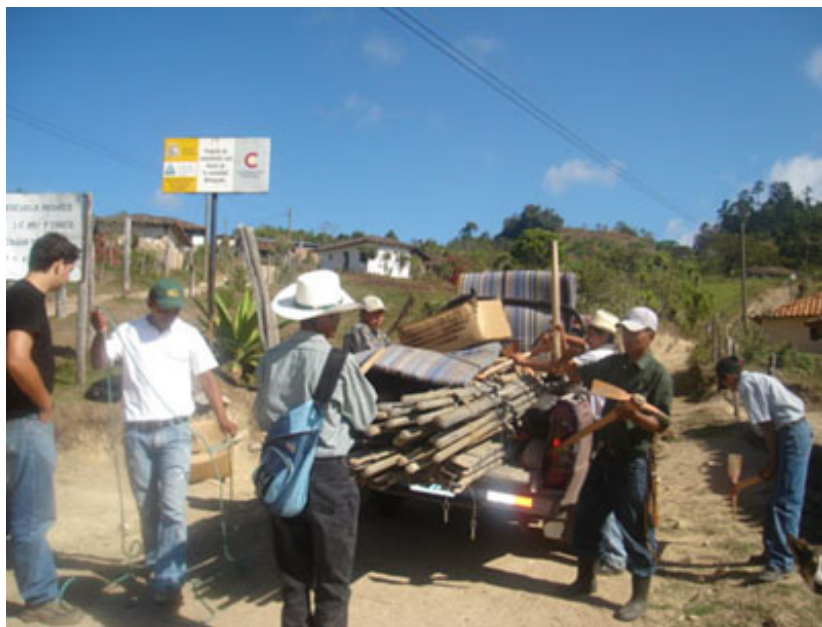
Líderes comunitarios cargan las cosas necesarias para los campamentos.