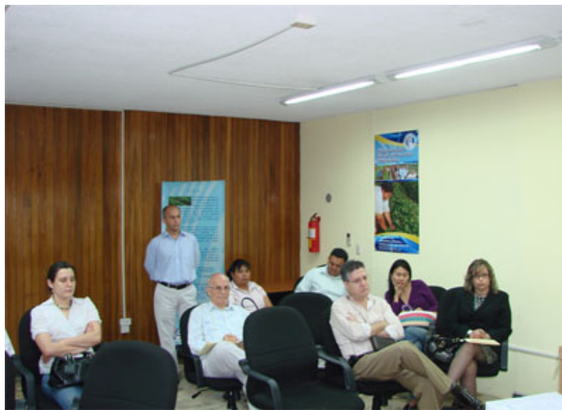
Parte de los asistentes al Acto de apertura de ofertas de la Licitación de Obras del Segmento II de la Carretera CA-5 Norte.

Se invita a oferentes calificados a participar en este proceso, próximamente también anunciado en los principales medios masivos de Honduras, que incluye: Bombas de mochila, bandejas para plántulas, sistemas de riego y, canastas plásticas y filtros de agua para uso agrícola.