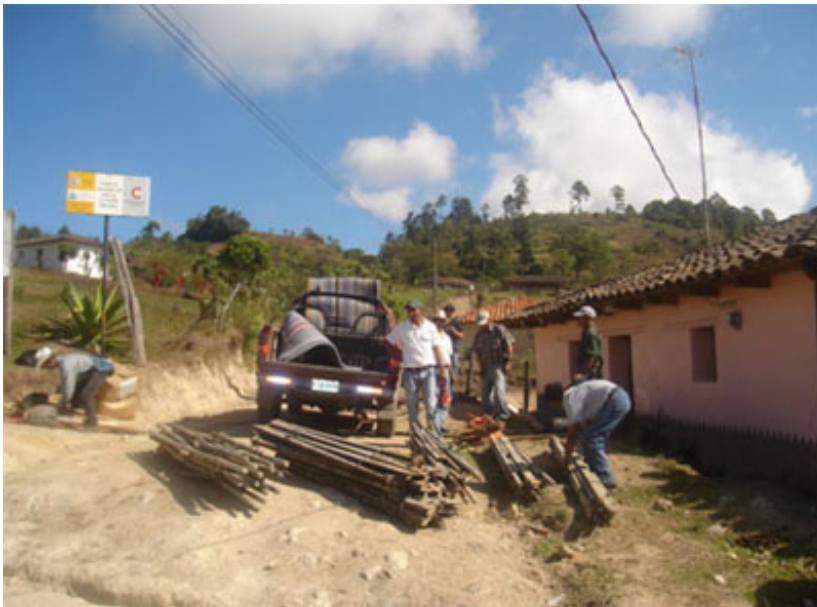
La protección de los agricultores al igual que el buen manejo de las hortalizas es fundamental para EDA.

Ocotepeque.- Con gran entusiasmo las comunidades beneficiarias del proyecto “Sistema Integrado de Producción” en el norte de Belén Gualcho, comenzaron la excavación de la